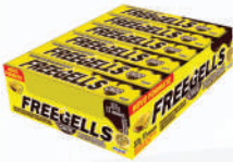
Maracujá c/ Chocolate 3332 | 30g