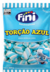
Torção Azul 09001 | 80g 11525024005 | 250g