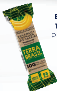
Bananinha Tradicional PR00081 | 30G