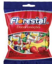
Bala Sortidas 82794 | 52g