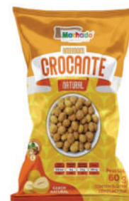
Amendoim Crocante Natural 1229 | 60g