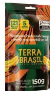
Bananinha Cobertura Chocolate PR00055 | 150g