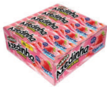
Azedinha Iogurt 2034 | 35g