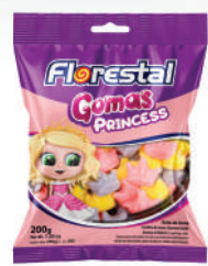
Princesas 83257 | 200g