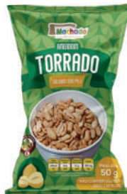
Amendoim Torrado e Salgado Sem Pele 1227 | 60g