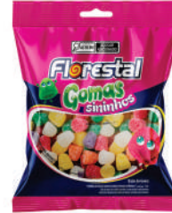
Sininhos Sortidos 83250 | 60g 83251 | 200g