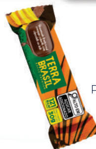
Bananinha Cobertura Chocolate PR00085 | 30g