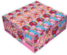
Lilith Tutti Frutti 2082 | 35g