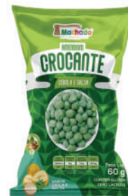
Amendoim Crocante Cebola e Salsa 1231 | 60g