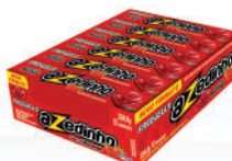
Azedinho Morango 3338 | 30g