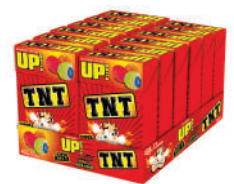
TNT Acido 2960 | 34g