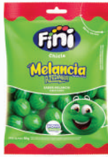
Melancia 01506 | 80g