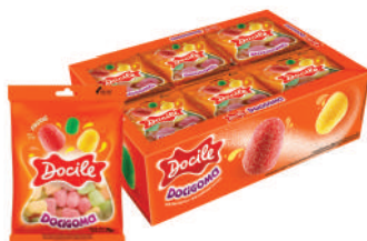
Frutas 80018 | 18g