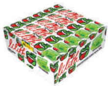
Lilith Maça Verde 1930 | 35g