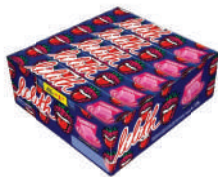
Lilith Framboesa 1998 | 35g