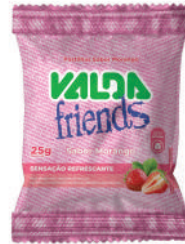
Valda Friends Morango Saché 431062 | 25g