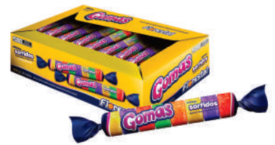
Goma Tubo Sortidas 30x30g 83609