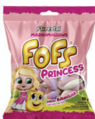
Princesa 82939 | 50g 82938 | 220g