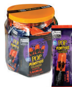
Pop Monsters Pote Laranja 0009 | 14g