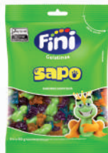
Sapo 83649 | 80g