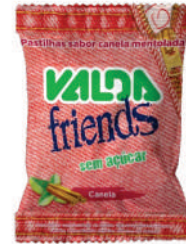
Valda Friends Canela Saché 431049 | 25g