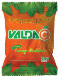
Valda C Saché 430080 | 24g