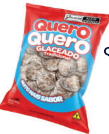
Quero Quero 1363 | 300g