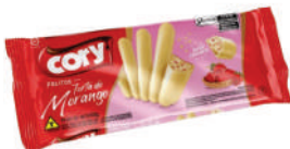
Torta de Morango 1240 | 68g