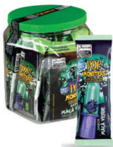
Pop Monsters Pote Maça Verde 0006 | 14g