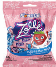
Zollé Iorgute 82562 | 60g