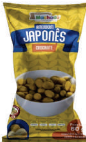
Amendoim Japonês 1224 | 60g