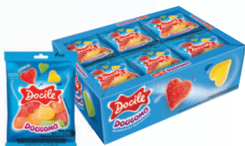
Coração 80016 | 18g