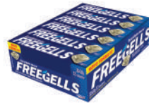
Eucalipto 3341 | 30g