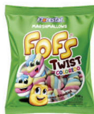
Twist Colorido 82621 | 50g 82622 | 220g