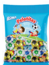
Pelotitas 1969 | 40g