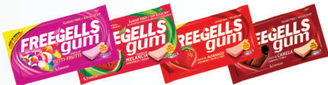
Tutti Frutti 3271 | 8g Melancia 3270 | 8g Morango 3268 | 8g Canela 3293 | 8g