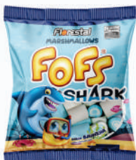
Shark 80254 | 220g