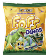
Dinos 82941 | 50g 82940 | 220g