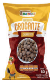
Amendoim Crocante Churrasco 1275 | 60g