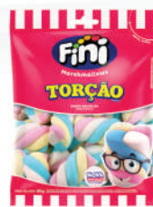
Torção 09001 | 80g