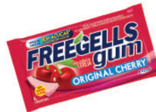
Cherry 3292 | 8g