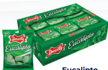
Eucalipto 80014 | 18g