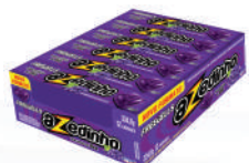
Azedinho Uva 3339 | 30g