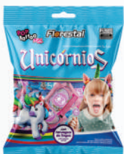
Pirulito Unicórnio Sortidos 83607 | 50g