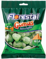
Eucalipto 83256 | 60g