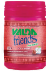
Valda Friends Ice Cherry 431774 | 50g