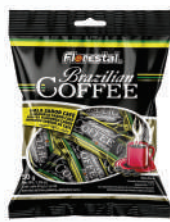
Brazilian Coffe 82510 | 50g