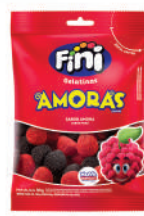
Amoras 00104 | 90g 83631 | 15g