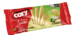
Torta de Limão 1238 | 68g