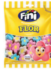
Flor 02801 | 80g 83679 | 250g