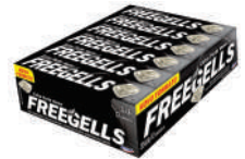
Extra forte 3342 | 30g