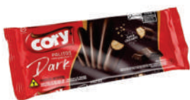
Chocolate Meio Amargo 1237 | 68g