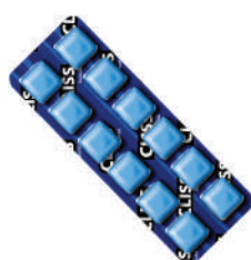
Hortelã 8716 | 8,37g