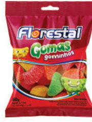
Gominhos de fruta 83253 | 60g