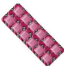
Cereja 81531 | 8,37g