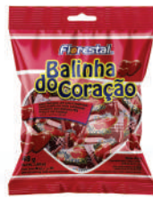
Bala Coração Morango 82513 | 48g