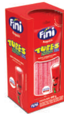
Morango Azedinho 20010 | 40g