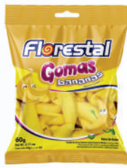
Banana 83592 | 60g 83259 | 200g