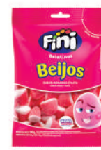
Beijos 02002 | 90g 83633 | 15g