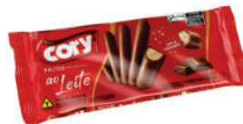
Chocolate Ao Leite 1005 | 68g