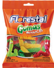
Minhocinhas 83263 | 65g 83261 | 200g