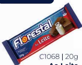
C1068 | 20g Ao Leite