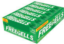
Menta 3343 | 30g