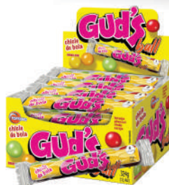
Gun Balls Sortido 107324 | 18g