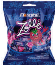
Zollé Franboesa 82782 | 60g