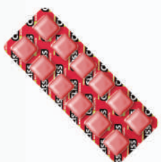
Melancia 83093 | 8,37g