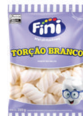
Torção Branco 11525017101 | 250g