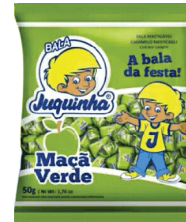
Juquinha Maça Verde 81268 | 50g