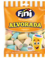
Alvorada 00101 | 80g 11525019701 | 250g