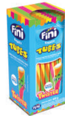
Twister 20110 | 40g