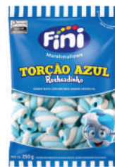
Torção Azul 09001 | 80g