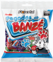
Pirulito Pegadas Banzé Sortidos 83608 | 50g