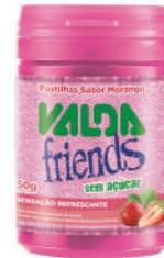
Valda Friends Morango Pote 431063 | 50g