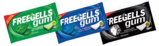
Menta 3265 | 8g Hortelã 3266 | 8g Extra Forte 3267 | 8g