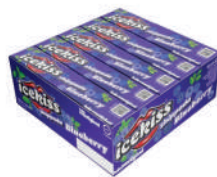
Icekiss Blueberry 2157 | 35g