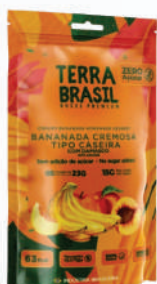
Bananinha Com Damasco PR00053 | 115g