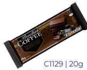
C1129 | 20g Brazilian Coffe Ao Leite