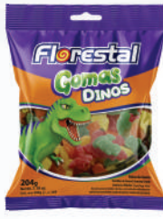
Dinos 83258 | 204g