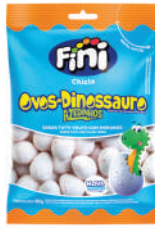
Ovos Dinossauro 01606 | 80g