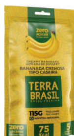
Bananinha Zero açúcar PR00093 | 115G