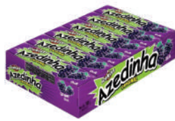
Azedinha Uva 1928 | 35g