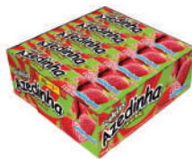
Azedinha Morango 1927 | 35g