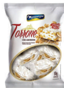
Torrone c/ Amendoim 1682 | 50g