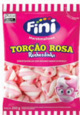
Torção Rosa Recheadinho 11525024105 | 250g