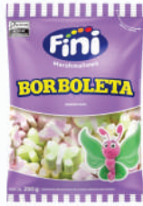
Borboleta 11525024106 | 250g