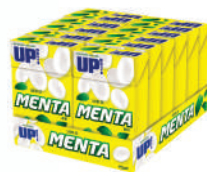
Menta 2858 | 34g