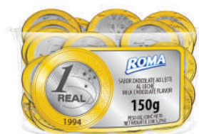
Moeda 1 Real 107 | 150g | 46un. 106 | 350g | 100un.