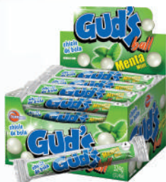
Gun Balls Menta 540324 | 18g