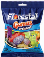
Ursinhos 83255 | 60g