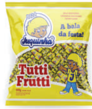
Juquinha Tutti Frutti 81120 | 50g