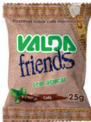
Valda Friends Café Saché 431047 | 25g