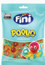
Polvo 83648 | 80g