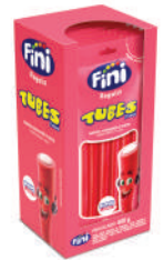
Morango 19910 | 40g