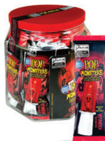
Pop Monsters Pote Cereja 0008 | 14g