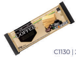
C1130 | 20g Brazilian Coffe Branco