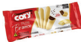
Duo Branco ao Leite 1239 | 68g