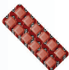
Canela 9524 | 8,37g