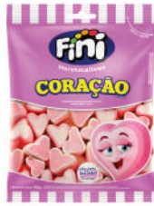
Coração 04501 | 80g