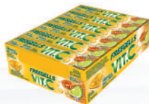
Vit C Limão e Mel 3348 | 30g