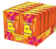
Sortido 2450 | 34g