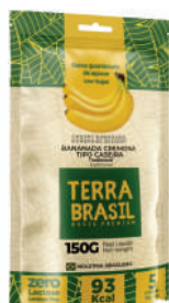
Bananinha Tradicional PR00051 | 150G