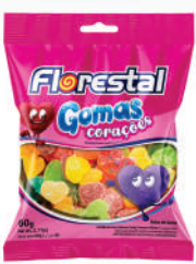
Corações Sortidos 83249 | 60g