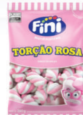
Torção Rosa 11525017501 | 250g