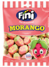
Morango 07301 | 80g