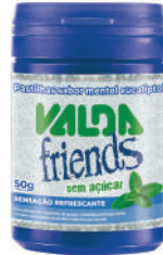
Valda Friends Menta Pote 431045 | 50g