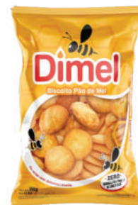
Dimel 1429 | 350g