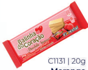
C1131 | 20g Morango Balinha do Coração