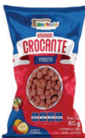
Amendoim Crocante Pimenta 1233 | 60g