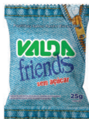
Valda Friends Menta Saché 431044 | 25g