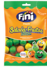
Salada de Frutas 01706 | 80g