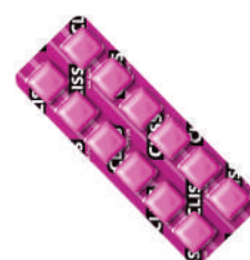
Tutti Frutti 8715 | 8,37g