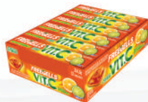
Vit C Cítrico 3337 | 30g