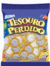
1 Real 103 | 40g