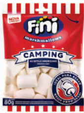
Camping 18401 | 80g 11525017401 | 250g