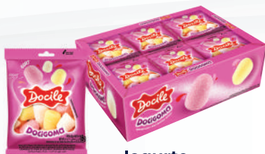
Iogurte 80015 | 18g