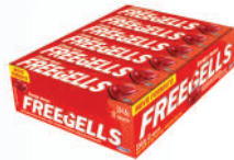
Cereja 3340 | 30g