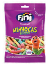
Minhocas Cítricas 13003 | 90g 83635 | 15g