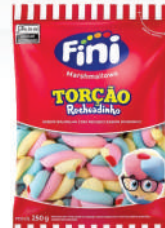
Torção Recheadinho 83670 | 250g