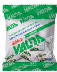
Valda Tabletes 431039 | 6 unid