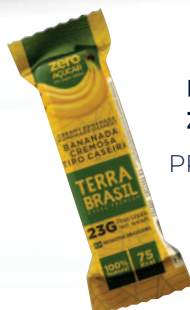
Bananinha Zero açúcar PR00082 | 23G