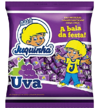
Juquinha Uva 81267 | 50g