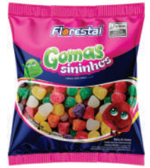
Sininhos Sortidos 83311 | 500g 83538 | 1kg