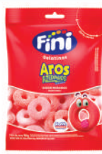
Aros 04003 | 90g