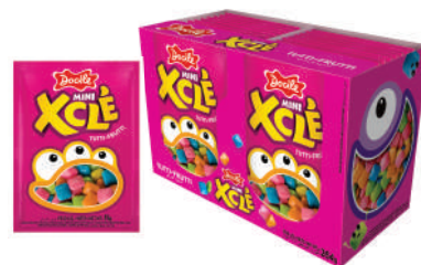
Xclé Tutti-Frutti 8550 | 11g