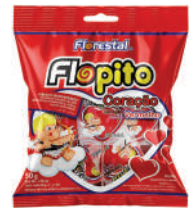
Pirulito Coração Vermelho 82495 | 50g