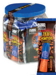
Pop Monsters Pote Blueberry 0007 | 14g